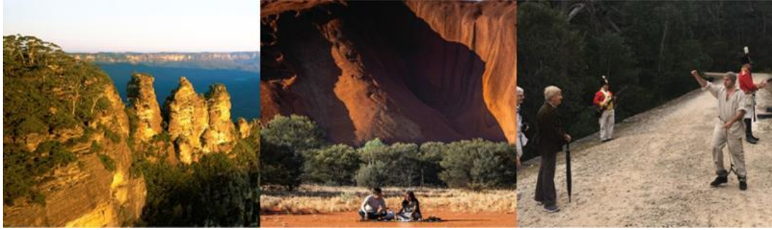
Imagen: Area del Patrimonio Mundial de la Region de las Montañas Azules