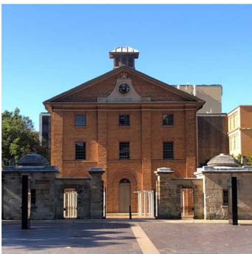
Image: Hyde Park Barracks – part of the Australian Convict Sites World Heritage property

As in past years, eligible registrants will be able to apply for financial support from the ICOMOS Victoria Falls/Mosi-oa-Tunya Fund. General information on the Fund is available on the ICOMOS website . Details on how to apply will be available on the GA2023 website and circulated to registered participants in coming months.