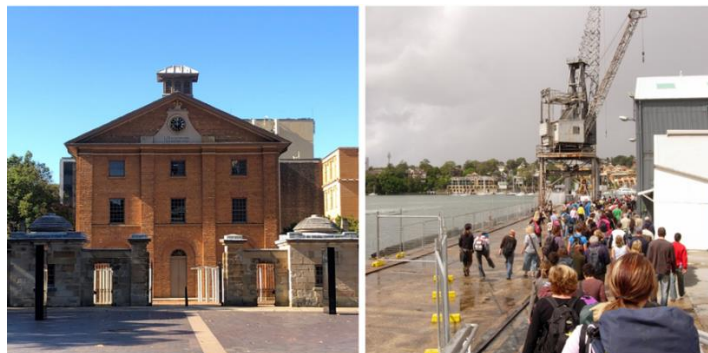
Imagen: Hyde Park Barracks: parte de la propiedad del Patrimonio Mundial de los sitios de convictos australianos

Como en años anteriores, los solicitantes elegibles podrán solicitar apoyo financiero del Fondo ICOMOS Victoria Falls/Mosi-oa-Tunya. La información general sobre el Fondo está disponible en el sitio web del ICOMOS . Los detalles sobre cómo presentar una solicitud estarán disponibles en el sitio web de AG 2023 y se distribuirán a los participantes registrados en los próximos meses.