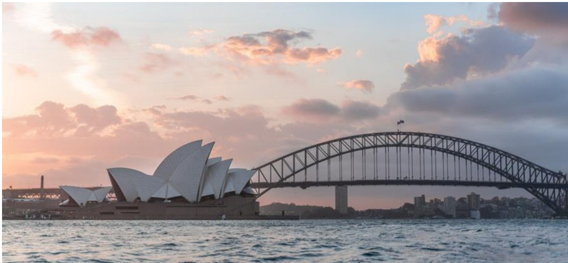
Image: L'Opéra de Sydney - un bien du patrimoine mondial et le lieu de la cérémonie d'ouverture de l'AG2023

L'Assemblée générale — «l'AG2023» — propose un programme passionnant de visites de sites, d'ateliers, de conférences, de réunions d'experts et d'événements sociaux, pendant dix jours.