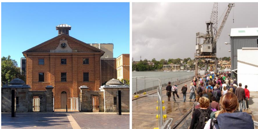
Image: Caserne de Hyde Park - fait partie du patrimoine mondial des sites de bagnes australiens.

Comme les années précédentes, les inscrits éligibles pourront demander un soutien financier au Fonds ICOMOS Victoria Falls/Mosi-oa-Tunya. Des informations générales sur le Fonds sont disponibles sur le site web de l'ICOMOS . Des informations détaillées sur les modalités de candidature seront disponibles sur le site web de l'AG2023 et diffusées aux participants inscrits dans les prochains mois.