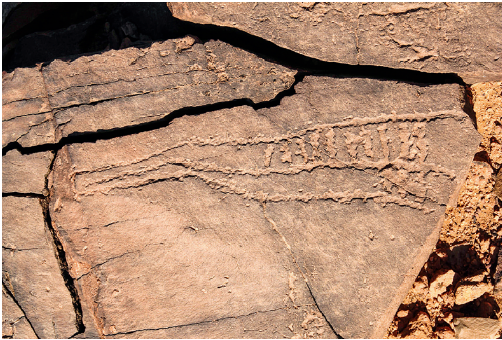
Fig. 1. Motif géométrique – 12 x 43 cm.