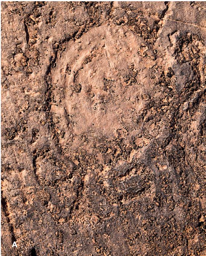
Fig. 9. A. Miroir – 5 x 26 cm ; B. Relevé.

Out of the 115 engraved stones, geometric motifs dominate (they are present on 88 stones) while animal representations are only found on 37 rocks. The geometric motifs are essentially quadrangular and spirals (Fig. 1-2). In the bestiary, bovines are the most numerous with 25 representations (Fig. 3-5). They are followed by ostriches and horses (7 representations for each species) (Fig. 6). The horses are