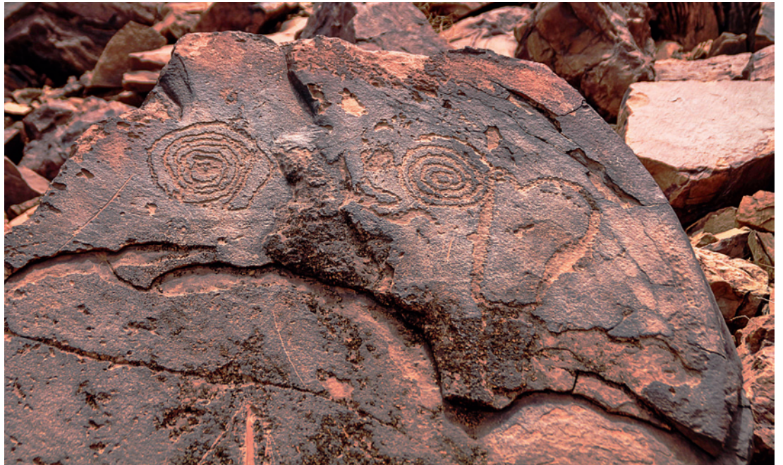
Fig. 2. Spirals – 15 x 15 cm.