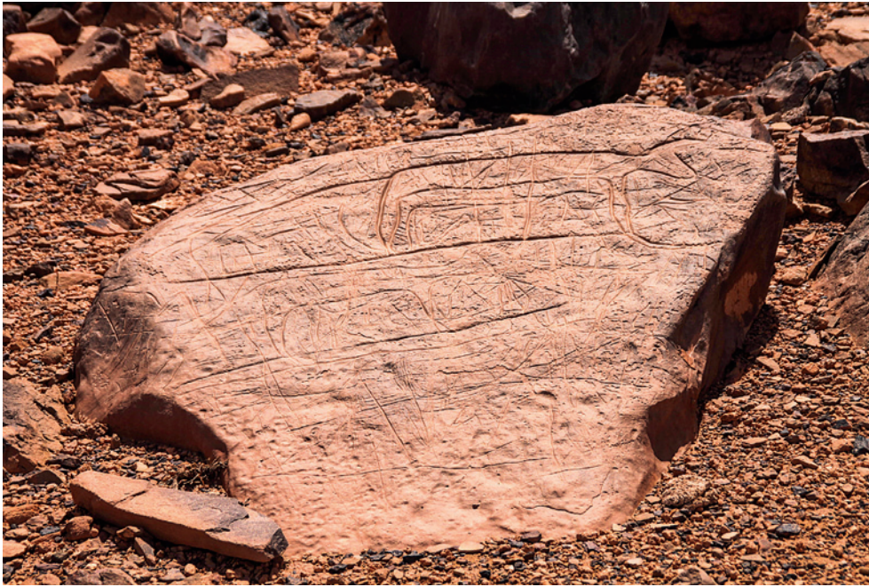
Fig. 4. Pierre avec bovines – Pierre : 93 x 106 cm.