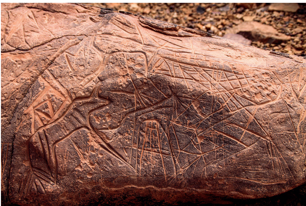
Fig. 3. Boviné (15 x 10 cm) et motifs géométriques.