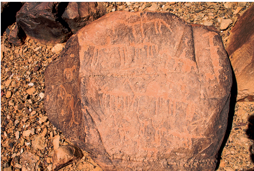
Fig. 6. Poignard, chevaux et autruches – Pierre : 55 x 55 cm.