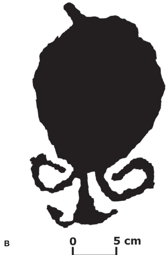
Fig. 9. A. Mirror – 5 x 26 cm ; B. Tracing.