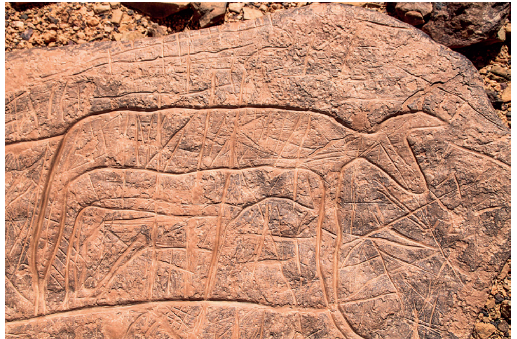
Fig. 5. Boviné – 52 x 26 cm.