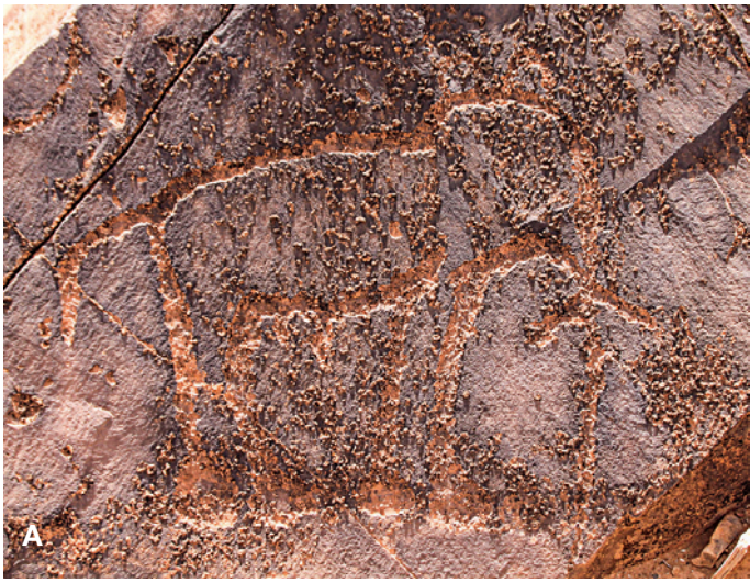
Fig. 7. A. Éléphant – 60 x 45 cm ; B. Relevé.