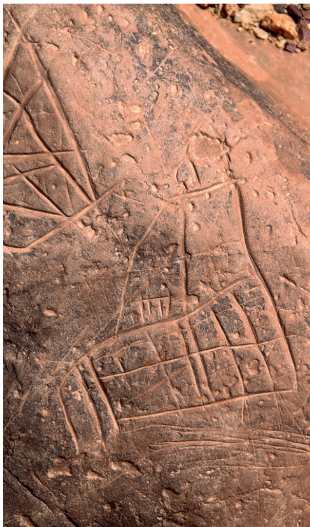
Fig. 10. Mosquée – 11 x 14 cm.

Seventeen stones were engraved with deep incisions. Rectilinear abstract lines are dominant, as well as quadrangular geometric motifs. The animals are bovinés, sometimes ostriches, the lines of their legs staying open and drawn out. This is the Tazinian style (Fig. 3 and 5). The stone is sometimes divided into superimposed “tables” (Fig. 4). Deep engrav-